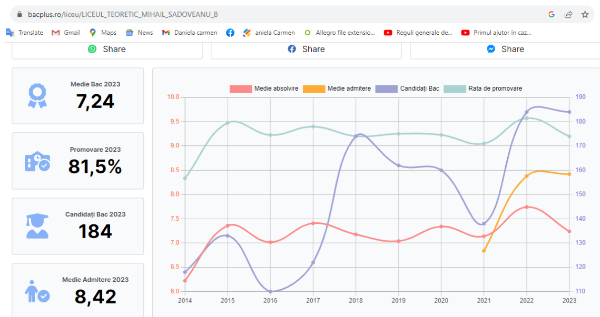
Grafic 2.1. Evoluția ratei de promovabilitate la bacalaureat în perioada 2014-2023